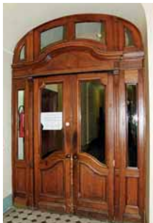
Vorher: Alter Bestand.