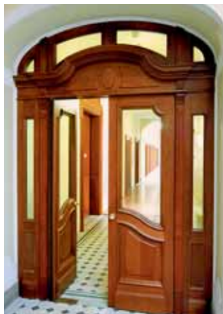
Nachher: Modernste Technik, denkmalgeschützte Optik nach historischem Vorbild.