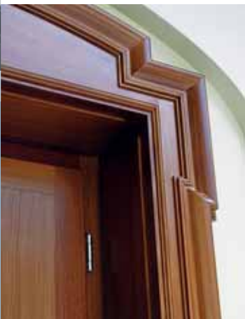
Liebevolle Gestaltung mit Profilierungen und Lisenen.

Anforderung vorhanden – gleichzeitig steht das Gebäude aber unter Denkmalschutz. Da der Bestand nicht nachzurüsten war, wurden insgesamt 28 ein- und zweiflügelige Elemente (davon 8 mit Seitenteilen und Oberlichten) exakt den historischen Vorbildern nachgebaut.